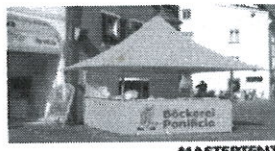
MASTER TENT Shop